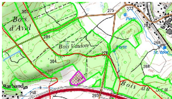
Estimation des lots